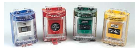
STI Verkrijgbare Stopper kleuren